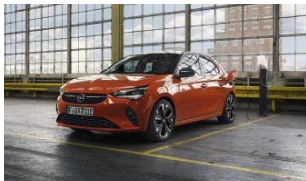
Nuevo Opel Corsa-e 100% Eléctrico. 100% fabricado en España