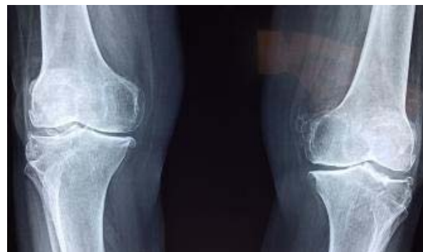
Sanidad privada a tu alcance Todo el mundo está cambiando a este seguro de salud...