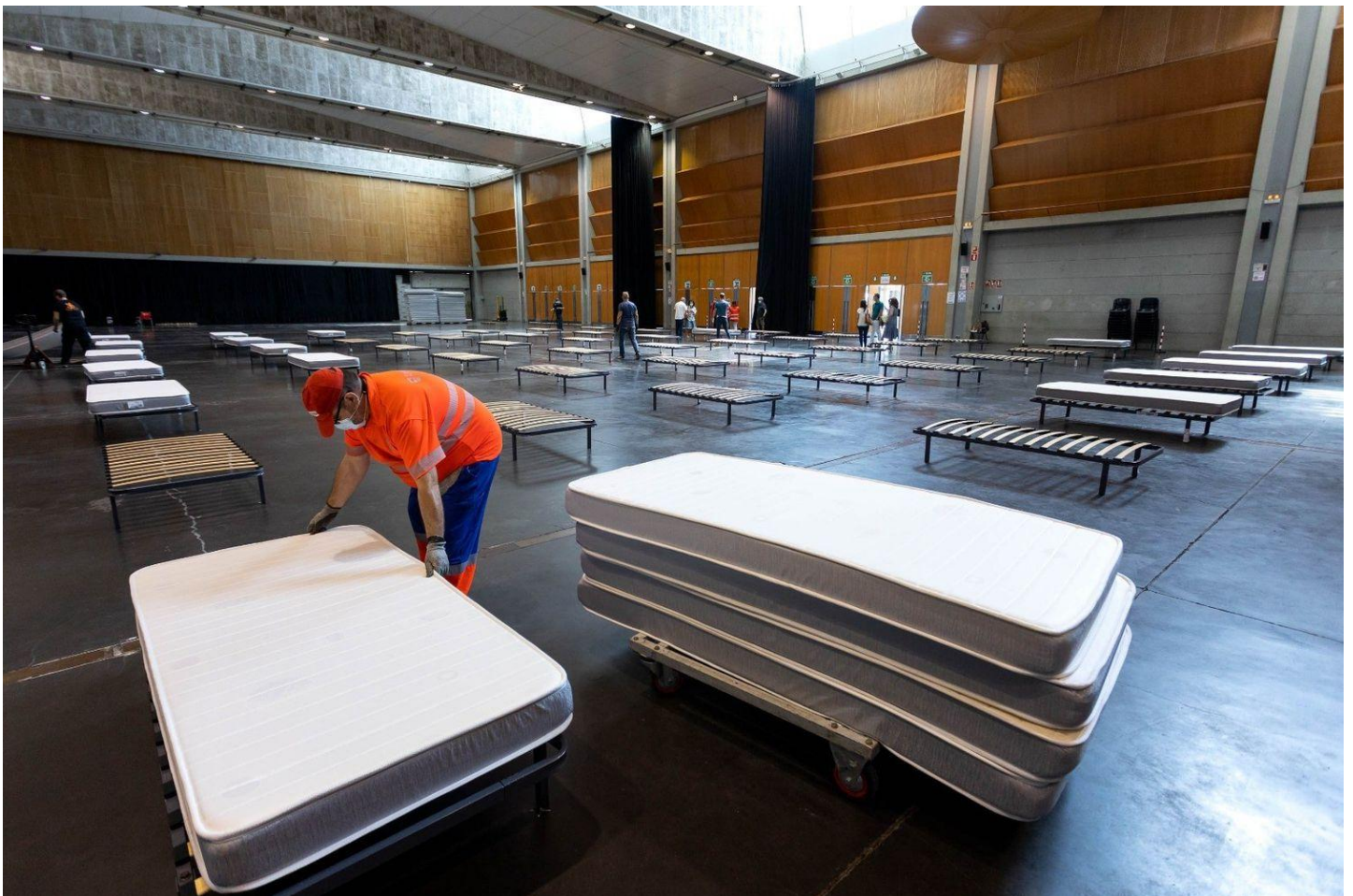
La sala multiusos de Zaragoza se ha habilitado para alojar a pacientes asintomáticos o con síntomas leves.

La capital de Aragón vive con creciente preocupación su retroceso a la fase 2 mientras calles y terrazas se vacían