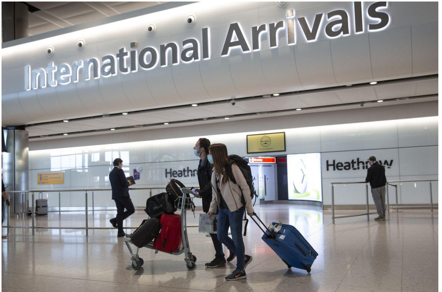
Pasajeros llegando al aeropuerto londinense de Heathrow el pasado 8 de junio.

A partir de la medianoche de este sábado, los que entren al país deberán aislarse 14 días